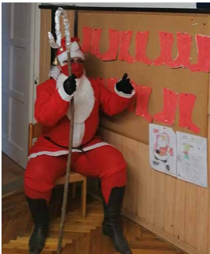
Mikulás az ajtóban