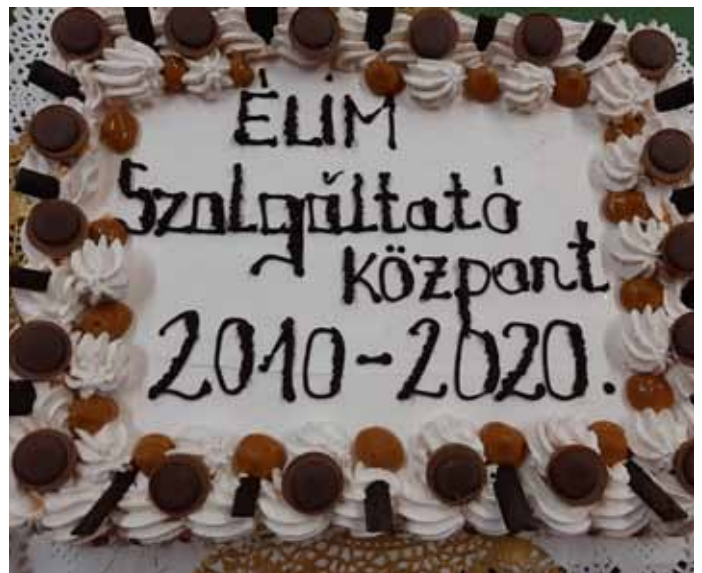
10 éves az intézményünk