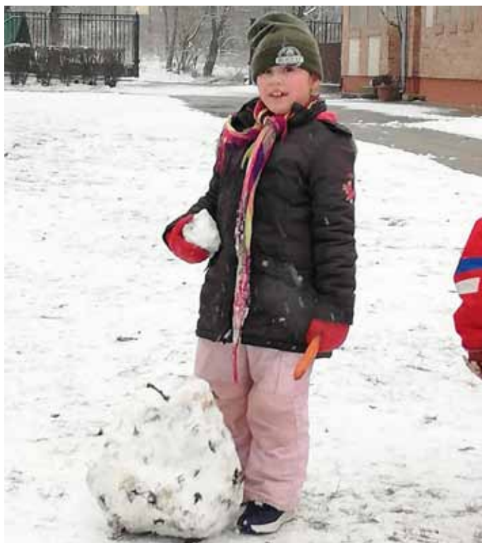
Hurrá! Esik a hó!